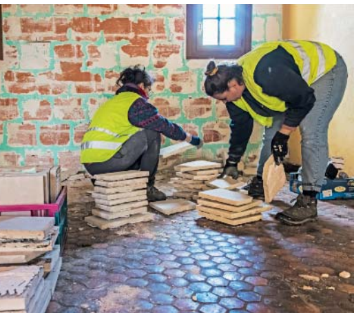
Le tuffeau servira à rénover un four à bois.