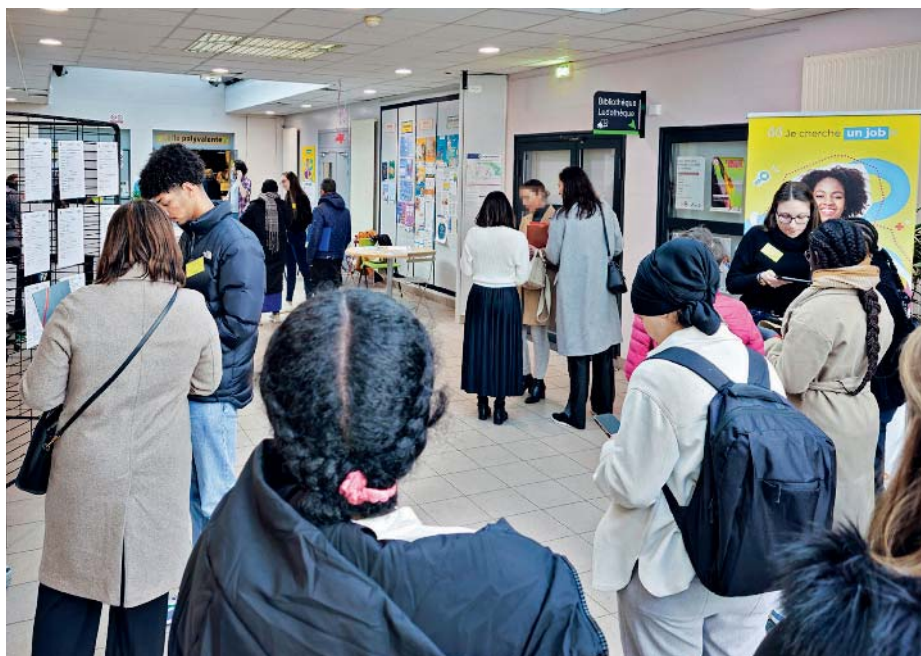
En 2024, Aldev a organisé sept rendez-vous pour l'emploi dans différents quartiers d'Angers.

Outre les rendez-vous "Angers emploi", Aldev propose également des "clubs", une préparation de groupe pour réintégrer le marché