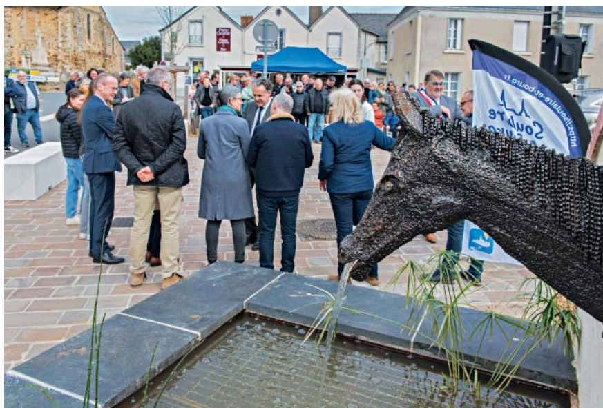
La place rénovée comporte une fontaine ornée d'une sculpture en forme de tête de cheval.

La place est scindée en deux avec, d'un côté, un espace piéton pavé et, de l'autre, des places de stationnement. Une fontaine a été construite, alimentée par l'ancien puits qui a été recouvert. Elle est ornée d'une sculpture de tête de cheval noire. “Nous avons choisi cet animal en référence aux élevages de chevaux de course, aux écuries de haut niveau et au centre équestre réputé installés dans la commune”, explique le maire. La sculpture, œuvre de l'artiste Tidjé, est fabriquée à partir de chutes de tiges de fer