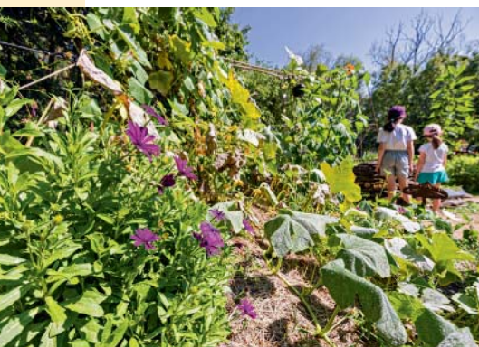
Le jardin bio de la maison de l'environnement, à Angers.

La maison de l'environnement, à Angers, est sur le pont tout l'été avec une multitude d'activités familiales : des sorties en kayak avec le muséum des sciences naturelles, des leçons de pêche pour petits (à partir de 6 ans) et grands (10 ans et plus), des balades contées sur la Maine (En Maine et moi avec l'Échappée anjouée), des