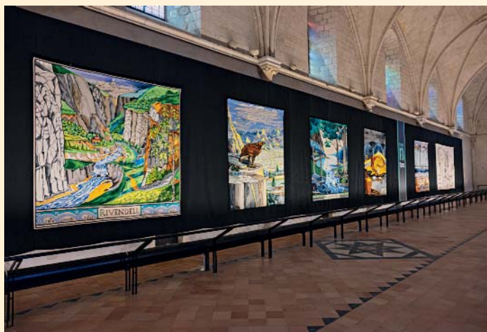
Aubusson tisse Tolkien, au musée Jean-Lurçat jusqu'en novembre.