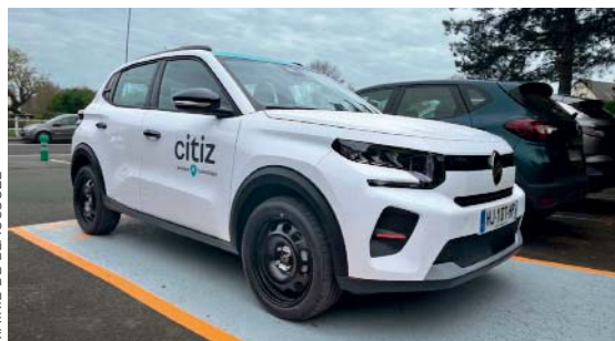
MAIRIE DE BEAUCOUZÉ

Une nouvelle station Citiz, baptisée "Centre Beaucouzé", vient d'être installée rue du Bourg-de-Paille (parking de La Poste). Elle met à disposition une Citroën C3 à boîte manuelle, accessible en libre-service via l'application Citiz. Ce service d'autopartage permet d'utiliser une automobile uniquement lorsque c'est nécessaire, évitant ainsi les coûts liés à la possession d'un véhicule. Quelques chiffres clés : une voiture partagée économise jusqu'à 19 000 km par an par rapport à un véhicule personnel et libère jusqu'à trois places de stationnement en voirie (source Ademe, enquête nationale autopartage 2022). Le tarif Citiz inclut le carburant, l'entretien et l'assurance. ■ citiz.coop