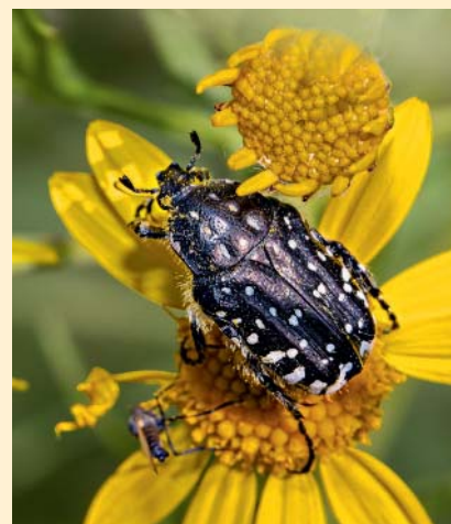
Une cétoïne funeste.

Avant de l’emprunter, le promeneur traverse une ancienne peupleraie où les séneçons, rumex, gratioles, plantains, épiaires, guimauves officinales et autres plantes caractéristiques du milieu colorent la prairie. Une véritable symphonie de teintes rouges, jaunes, mauves, vertes... Une fois arrivé au Pass’ Sarthe, plusieurs choix s’offrent au marcheur: continuer la boucle vers le Vieux-Cantenay, traverser la rivière et basculer sur un autre circuit dans les environs d’Écouflant avec un arrêt baignade aux Sablières ou alors migrer vers l’île Saint-Aubin, toujours au plus proche de la biodiversité du territoire. ■