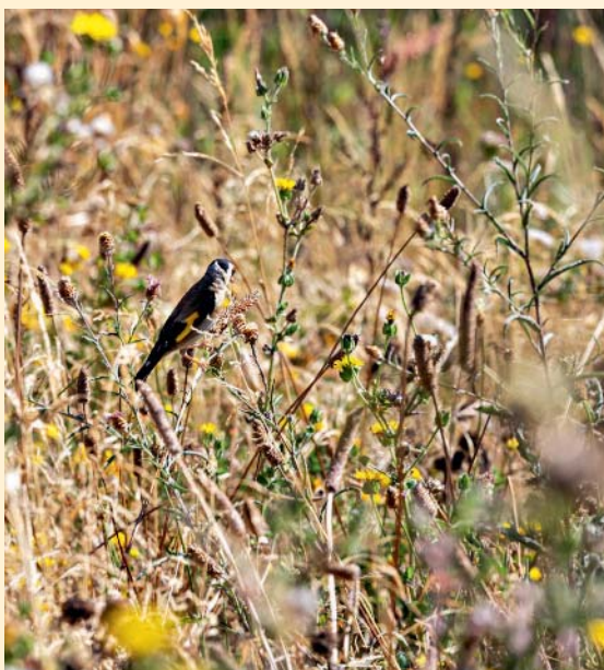
Observez la faune avec la Ligue pour la protection des oiseaux.

Gratuit. Détails et inscriptions sur lpo-anjou.org