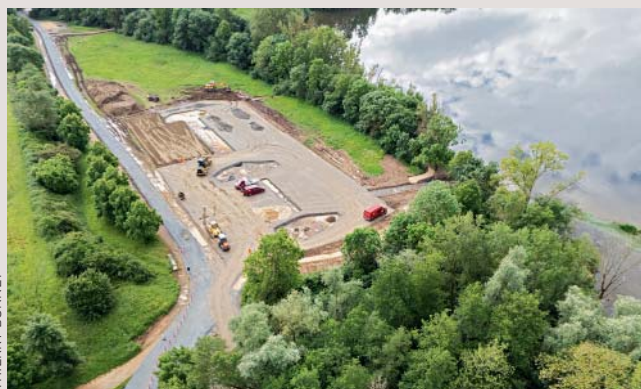
Une piste cyclable sécurisée et un parking avec une cale de mise à l'eau en construction au lac de Maine.

Plusieurs zones du lac de Maine sont actuellement en chantier, dont le pôle d'activités nautiques et la rive nord-est, proche du parc Balzac. L'objectif de ces travaux est pluriel : favoriser l'épanouissement de la flore existante (320 variétés répertoriées), replanter certaines parties du parc, préserver la faune (dont les 73 espèces d'oiseaux inventoriées) et les zones humides, restaurer les berges... Le lac de Maine, d'une surface de 200 ha, contribue à maintenir la fraîcheur du centre-ville d'Angers et à absorber les émissions de gaz à effet de serre. Sur le volet des déplacements, le but de ce réaménagement d'ampleur est de dessiner un axe principal pour les cyclistes, séparé des piétons et de limiter la présence des voitures sur le site. Cette première phase de travaux s'étendra sur 18 mois. Elle est menée en parallèle de la réhabilitation de la pyramide.