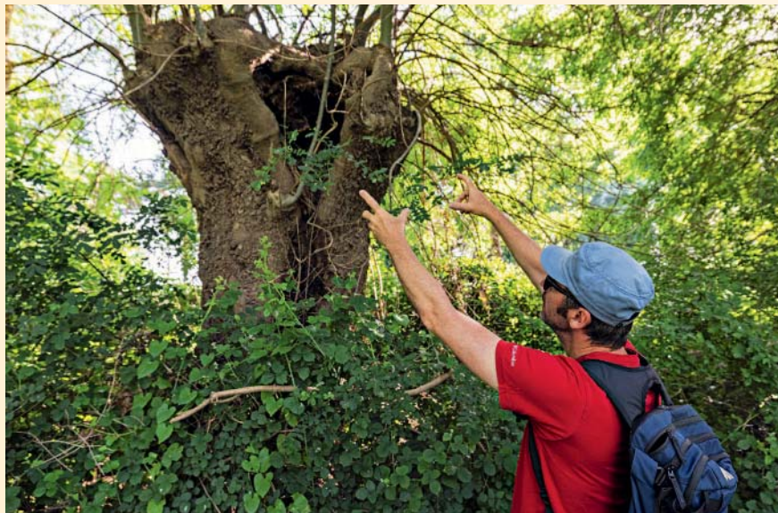
Grâce à l'étéage, l'écorce des frênes se creuse en cavités qui abritent une faune diversifiée comme certaines espèces de chauves-souris ou d'oiseaux nicheurs.

P ar temps estival, les Basses Vallées angevines font office de climatiseur naturel. Au départ de Cantenay-Épinard, au pied du pont qui franchit la Mayenne, le sentier cerné par les herbes hautes, perlées de rosée, rafraîchit le randonneur. Même effet apaisant le long du bocage où paissent les vaches. Le chemin est bordé de chênes et de frênes, pour certains pluri-centenaires, qui forment une canopée bienfaitrice au-dessus du marcheur. Il ne reste plus qu'à se délecter du paysage. À contempler cette mosaïque de verts : le foncé des joncs, le vert-jaune des carex et les plumeaux clairs des baldingères. Les Basses Vallées angevines, que l'on peut parcourir à pied ou à vélo grâce aux circuits balisés par l'office de tourisme de Destination Angers, ont été labellisées Natura 2000 en 2004. "C'est une reconnaissance européenne d'un habitat naturel qui abrite des espèces protégées de la faune et de la flore", explique Sylvain Chollet, chargé de mission Biodiversité à Angers Loire Métropole.