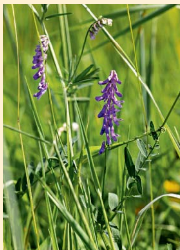
Une vesce craque.