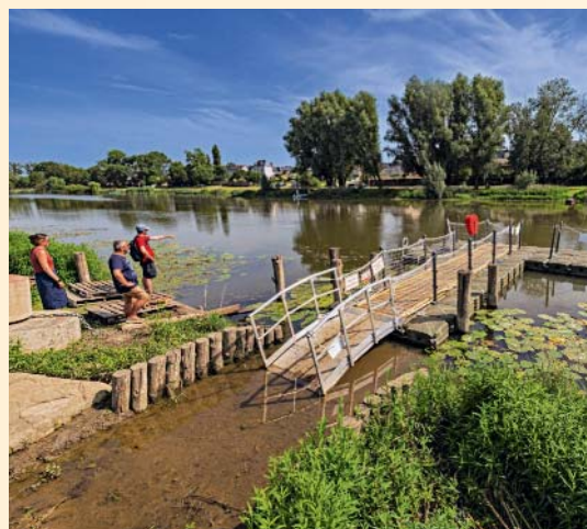
Le bac électrique Pass'Sarthe relie Cantenay-Épinard à Écouflant.