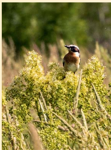
Un tarier des prés dans les prairies.

Grâce à cette coupe, l'écorce se creuse par endroits pour former une cavité. Les champignons s'y développent et attirent larves, insectes, chauves-souris et oiseaux nicheurs. "La mise en têtard des frênes est une pratique ancienne reconnue au titre de Natura 2000 car ils servent de gîtes pour