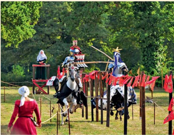
CHÂTEAU DU PLESSIS-BOURRÉ

À Écuillé, le château du Plessis-Bourré accueille le tournoi de l'Ordre de Saint-Michel, les 5 et 6 septembre. Au programme : joutes et jeux équestres, combats de béhourd, spectacle de fauconnerie, campement reconstitué, marché d'artisans, musiques et danses médiévales, visites du château. ■