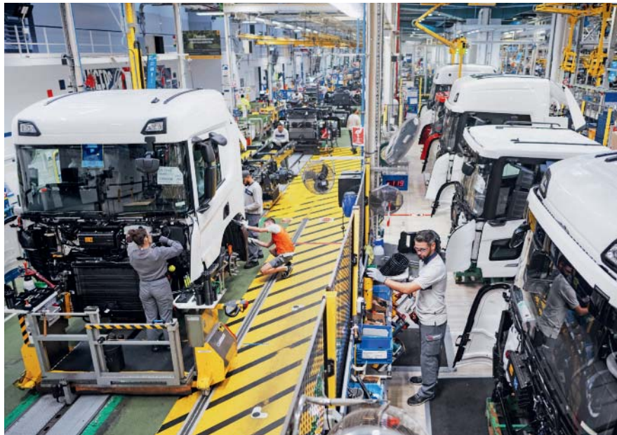
Pour produire des camions électriques, le Suédois Scania investit 70 M€ dans son site angevin.

Autre annonce spectaculaire, toujours dans le cadre de Choose France : le