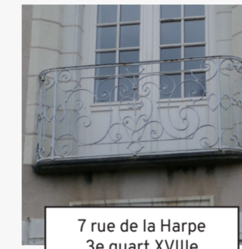
7 rue de la Harpe 3e quart XVIIIe (14)