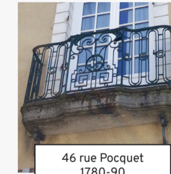
46 rue Pocquet 1780-90 (13)