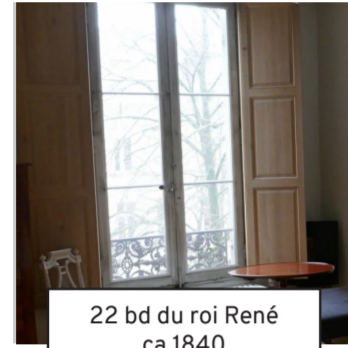
22 bd du roi René ca 1840 (22)