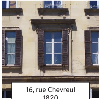
16, rue Chevreul 1820 (18)