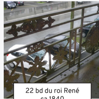
22 bd du roi René ca 1840 (23)