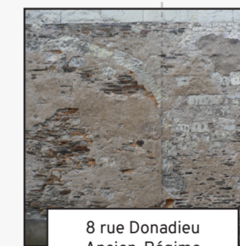
8 rue Donadieu Ancien-Régime (19)