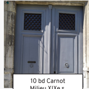
10 bd Carnot Milieu XIXe s. (26)