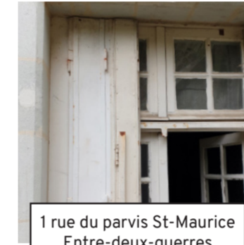
1 rue du parvis St-Maurice Entre-deux-guerres (02)