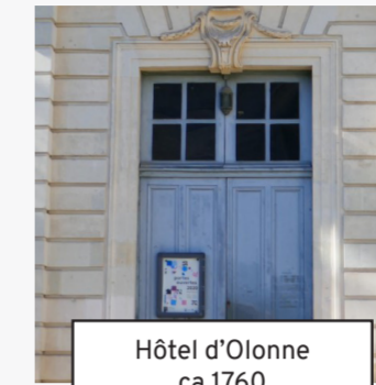
Hôtel d'Olonne ca 1760 (10)