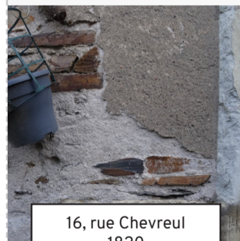
16, rue Chevreul 1820 (17)