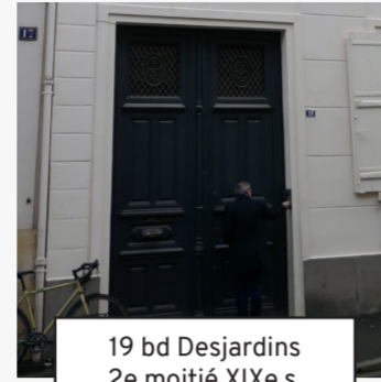
19 bd Desjardins 2e moitié XIXe s. (27)