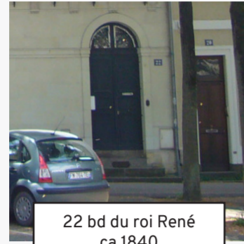
22 bd du roi René ca 1840 (21)