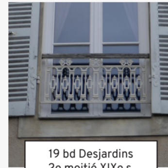
19 bd Desjardins 2e moitié XIXe s. (28)