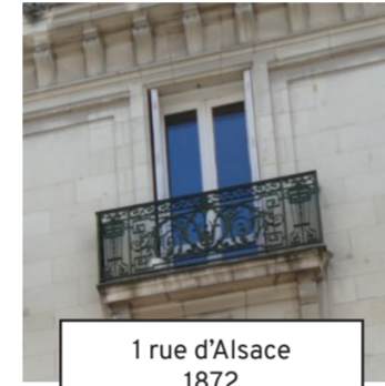
1 rue d'Alsace 1872 (11)