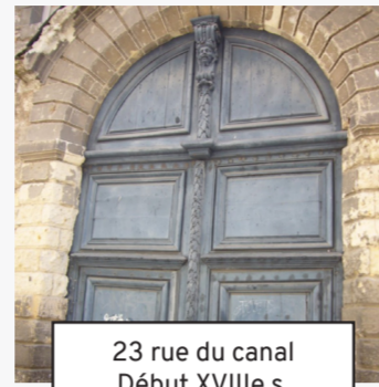
23 rue du canal Début XVIIIe s. (8)