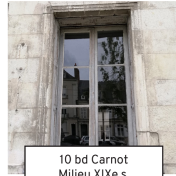
10 bd Carnot Milieu XIXe s. (25)