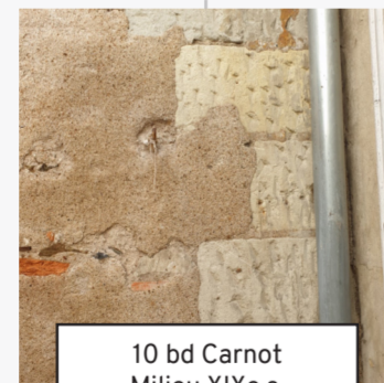
10 bd Carnot Milieu XIXe s. (24)