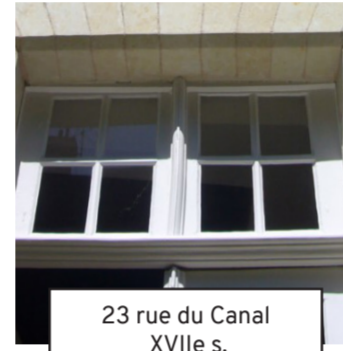
23 rue du Canal XVIIe s. (3)