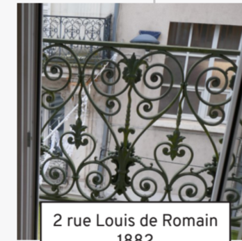
2 rue Louis de Romain 1882 (29)