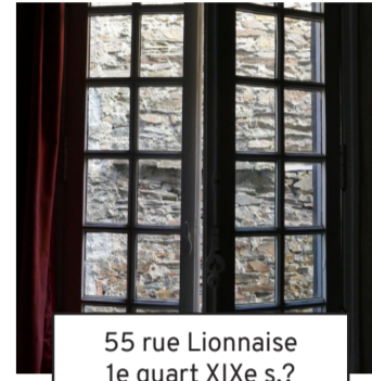
55 rue Lionnaise 1e quart XIXe s.? (15)