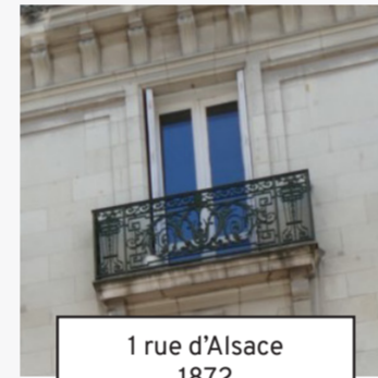
1 rue d'Alsace 1872 (7)