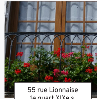
55 rue Lionnaise 1e quart XIXe s. (16)