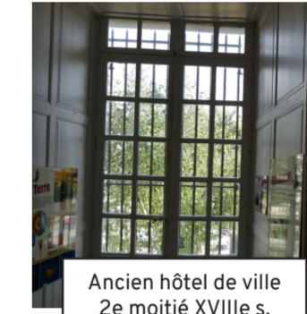
Ancien hôtel de ville 2e moitié XVIIIe s. (4)