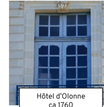
Hôtel d'Olonne ca 1760 (9)