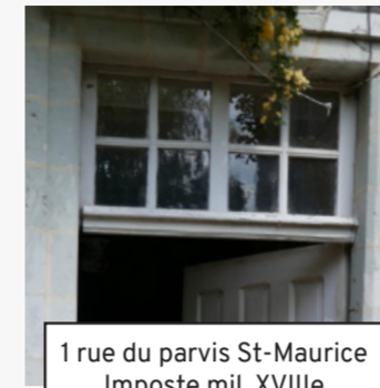
1 rue du parvis St-Maurice Imposte mil. XVIIIe (1)