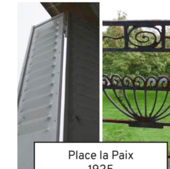
Place la Paix 1925 (30)