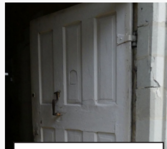
1 rue du parvis St-Maurice XVIIe s. (1)