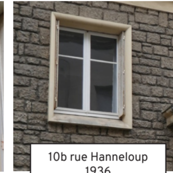
10b rue Hanneloup 1936 (5)