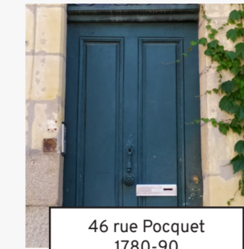
46 rue Pocquet 1780-90 (12)