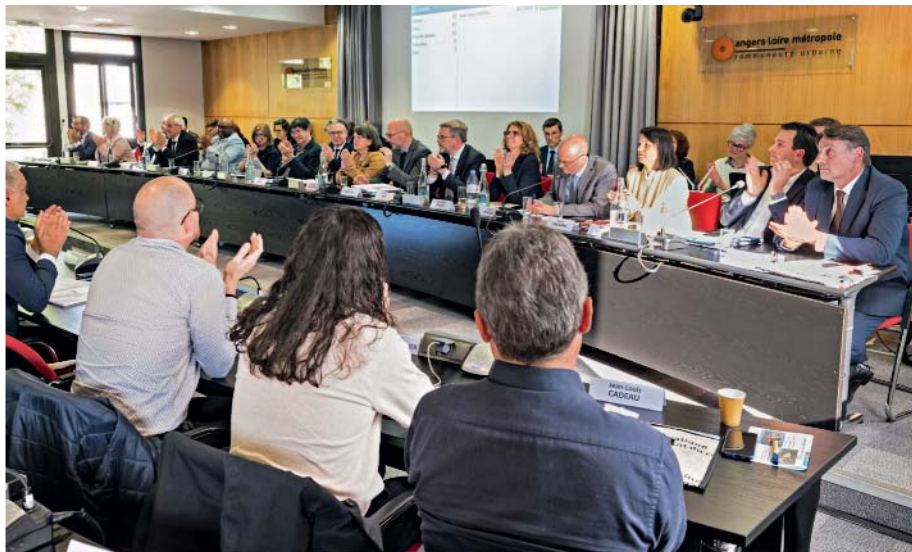
Le président et les quinze vice-présidents élus lors du conseil communautaire, le 13 avril.

Comme nous l'avons fait jusqu'à présent, nous allons veiller à ce que ce développement reste maîtrisé et équilibré entre la ville centre et les communes, dans le souci permanent de l'intérêt général. En cela, le tramway est un bon exemple. Il est déployé à Angers mais il permet de limiter le nombre de voitures en