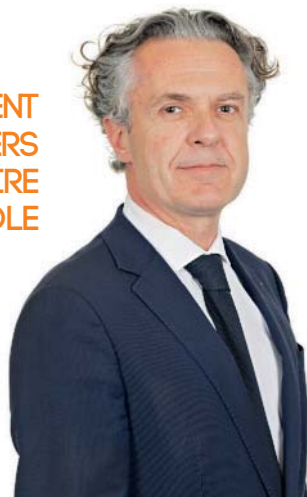
Christophe Béchu Maire d'Angers