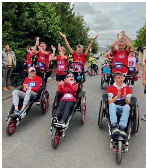
L'association Team I-Romane lors de la course La Grammoirienne en 2025.

de sa fille en situation de handicap depuis sa naissance. L'an dernier, l'arrivée de Romane, poussée sur la ligne d'arrivée par l'athlète multimédaillée Catherine Thomas-Pesqueux, reste l'une des belles images de la course. En pratique, la Grammoirienne se tiendra le samedi 30 mai avec deux courses de 5 et 10 km qualificatives pour le championnat de France. Et deux autres courses plus étonnantes, pour le plaisir de participer: l'une "à l'anglaise" d'un mile (1,609 km) et l'autre "à l'américaine" soit un sprint de 300 à 400 m où 15 compétiteurs s'affrontent. Un coureur est éliminé à chaque tour. Ce défi, unique en France, galvanise chaque année le parc de la mairie du Plessis-Grammoire.