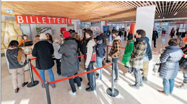
De l'accueil aux visites guidées, de nombreux services sont à disposition des organisateurs d'événements.

Le but n'est pas seulement de louer des espaces. Choisir le centre de congrès et le parc des expositions, c'est bénéficier d'une multitude de services, en amont, pendant, et après l'événement. Destination Angers met sa centrale d'hébergement à disposition des organisateurs, soit la possibilité de préserver des chambres pour ses collaborateurs, à tarif constant, avec mise en ligne d'une plateforme réservée aux participants. La structure peut mettre en place une conciergerie, propose de superviser les inscriptions ou de gérer l'accueil en gare et les navettes. Selon les besoins, elle prend en main la communication, le sponsoring, la scénographie ou la gestion des exposants. Ses 44 prestataires partenaires l'épaulent dans toutes sortes de tâches liées au nettoyage, à l'accueil, à la maintenance, à la gestion des déchets, à la sécurité, à la couverture photo et vidéo. Le petit plus : Destination Angers concocte aussi des visites guidées bilingues du patrimoine local pour agrémenter ou prolonger le séjour des congressistes et, ainsi, transformer le touriste d'affaires en touriste tout court.