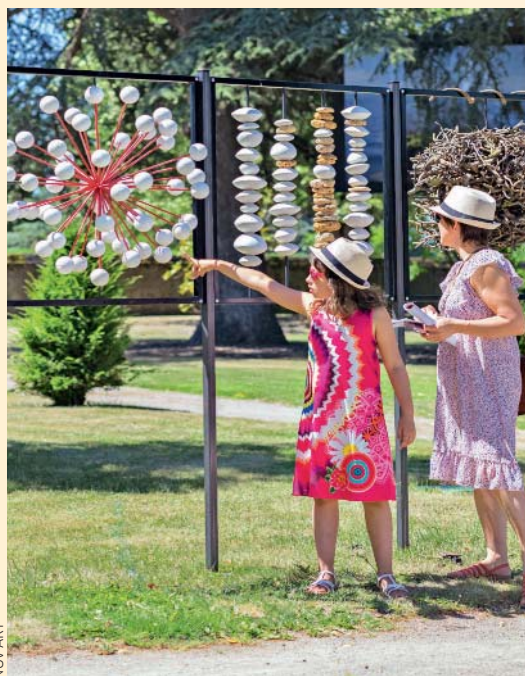
Le parcours Nov'Art, à Villevêque, revient pour une 42 e édition, jusqu'au 22 septembre.