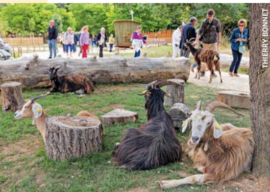
La clairière aux animaux.