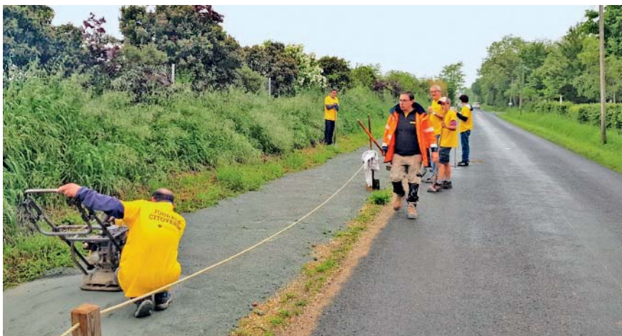
Les Soleirébourgiens se mobilisent pour des travaux d'entretien dans leur commune.

Soulaire-et-Bourg organise la 8 e édition de sa traditionnelle "Journée citoyenne" le samedi 14 septembre, en matinée. Les années précédentes ont permis l'aménagement d'une zone de jeu pour les enfants et d'un terrain de pétanque, d'effectuer les travaux de préparation pour la construction du city-stade, d'embellir et d'entretenir l'école. Les forces vives du village ont aussi œuvré à la réhabilitation de la bibliothèque, des vestiaires de la