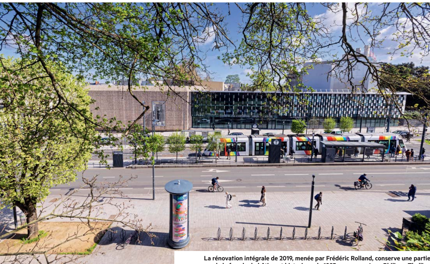
La rénovation intégrale de 2019, menée par Frédéric Rolland, conserve une partie de la façade du bâtiment historique de 1983, conçu par Jean-Philippe Thellier. L'auditorium (ci-dessous) a été entièrement revisité avec une acoustique haut de gamme.