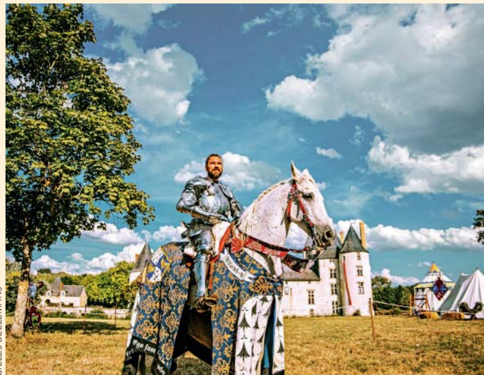
Le tournoi de l'Ordre de Saint-Michel fête sa 10 e édition.