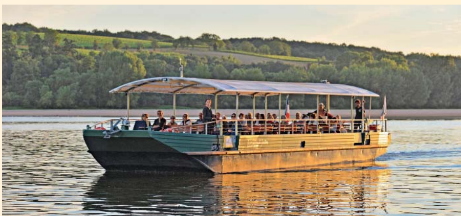
Apéro sur l'eau ou dîner-concert, Loire Odyssée propose un vaste choix de croisières tout l'été.