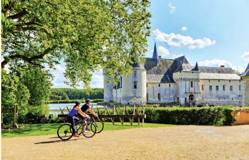
Les touristes peuvent visiter tout le territoire à vélo. Ici, au château du Plessis-Bourré.