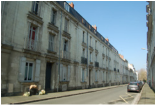
Rue Tarin Angers

Ces fronts bâtis sont des ensembles bâtis séquentiels pour la plupart localisés dans le centre d'Angers et correspondant à une architecture construite en grande partie au XIX ème et début XX ème siècles.