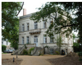
57 rue Volney Angers