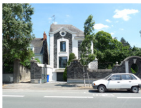
75 rue Jean Joxé Angers