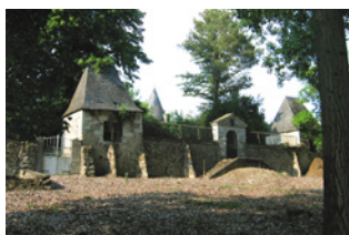
Villa de la Jourdanerie Briollay

Nota : Certains bourgs ou hameaux, bien que situés en bord de rivière, mais dont l'intérêt dominant n'est pas en lien avec l'eau, ne sont pas classés dans cette catégorie.