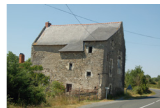
« Luigné » Saint-Lambert- la-Potherie