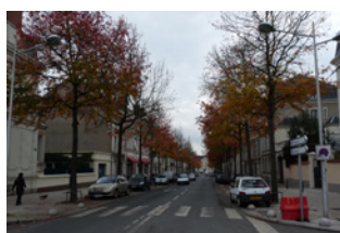
Avenue de Contades Angers