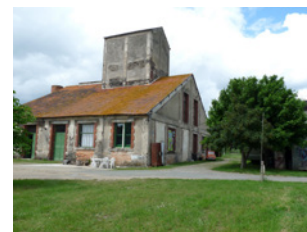
Usine de l'île d'Amour Ecoflant