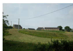
La Haute Roussière La Membrolle-sur-Longuenée