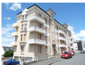
6/8 square Alexandre 1 er Angers

Sont identifiés dans cette sous-catégorie des architectures particulières de par leur usage (équipement, grand magasin, etc.) et/ou de par leur époque de construction (architecture contemporaine) ayant un impact certain sur leur environnement (rue, quartier)