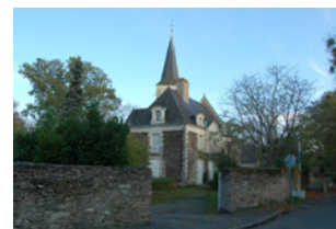
Eglise et presbytère Mûrs-Erigné