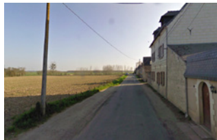
Noyan village Soulaire-et-Bourg