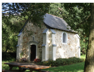
Chapelle de la Touche aux Ânes Saint-Léger-des-Bois