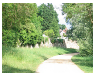
Chemin du Loir Soucelles