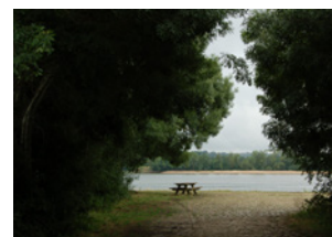
Loire-Authion Saint-Mathurin-sur-Loire Port Pigeau