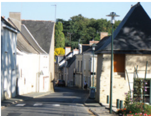
Rue de la Mairie La Meignanne