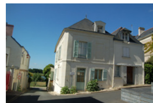
Rue du Port Ecoufant