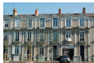
Îlot Carnot / Talet / Buffon / Maine Angers