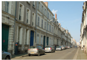
Rue Desjardins Angers