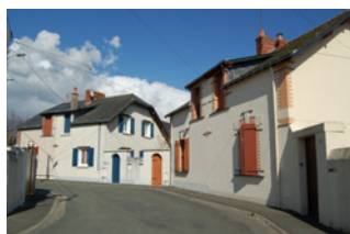
Rue de la Concorde Trélazé