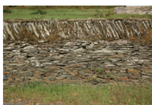
Chemin de l'Hermitage Sainte-Gemmes-sur-Loire