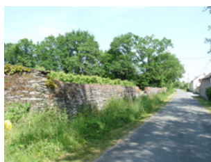
Chemin des Landes Trélazé

Sont identifiés dans cette sous-catégorie les murs et les murets identitaire d'un paysage de par leur linéaire important, et/ou leur très grande qualité