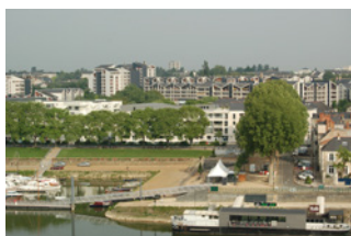
Cale de la Savatte Angers

Sont identifiés dans cette sous-catégorie des espaces ouverts de qualité de par leur organisation et parfois la qualité du bâti les structurant. Il s'agit d'espaces plus ou moins végétalisés, reconnus pour leur qualité urbaine (places urbaines majeures, square, etc.)