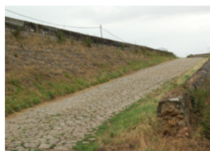
Loire-Authion Saint-Mathurin-sur-Loire rampe d'accès