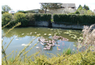
La Basse Marzelle Soulaines-sur-Aubance

Sont identifiés dans cette sous-catégorie des mares maçonnées et des lavoirs, les plus marquants dans le paysage ou identitaires d'un paysage.