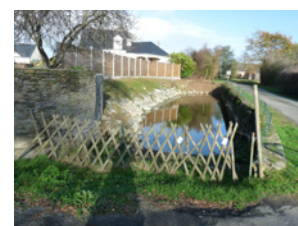
Les Balluères Soulaines-sur-Aubance