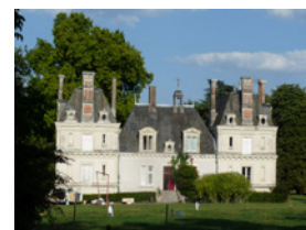
Château de Coincé Feneu