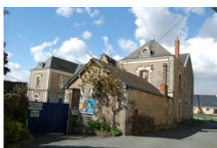
Ancien presbytère Trélazé

Sont identifiés dans cette sous-catégorie des bâtiments construits pour un usage culturel : églises, couvents, chapelles, oratoires, presbytères, etc.