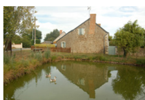
La Haute Grollière Soulaines-sur-Aubance