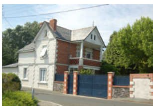
40 Port du Grand Large Les Ponts-de-Cé