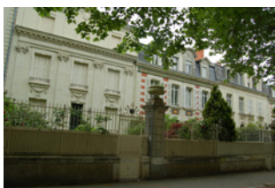
Avenue Jeanne d'Arc Angers