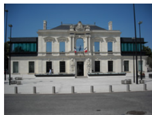
Hôtel de ville Trélazé