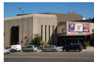
Centre des Congrès Angers