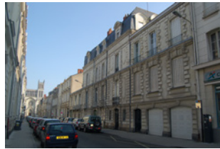
Rue des Arènes Angers