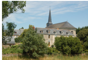
Vue perspective sur l'église Soucelles