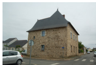
Poste de Garde Le Plessis-Macé