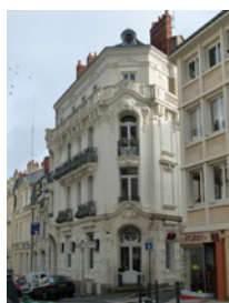
Immeuble baroque 15 rue St Martin Angers

Sont identifiés dans cette sous-catégorie des édifices possédant des caractéristiques architecturales de grande qualité tels que des maisons de maître, des châteaux, des hôtels particuliers, des maisons marchandes, des immeubles de type haussmannien etc.