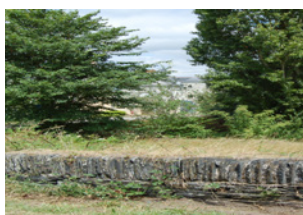
Loire-Authion La Daguenière mur - Les Baillis