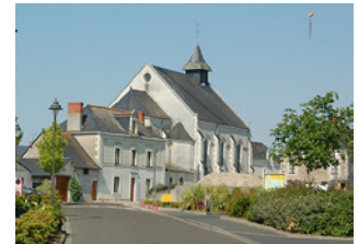
Bourg compact Saint-Martin-du-Fouilloux