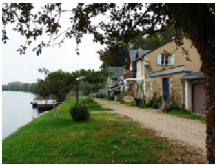
La Roussière La Membrolle-sur-Longuenée

Sont identifiés dans cette sous-catégorie des quartiers, îlots et/ou sites qui présentent un caractère singulier sur le territoire de l'agglomération, par leur organisation, structuration, morphologie, implantation et/ou qualité du bâti, perception depuis l'espace public, intérêt historique, etc.