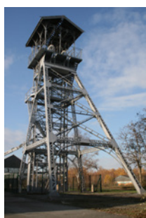
Chevalement Eiffel Trélazé

Sont identifiés dans cette sous-catégorie des bâtis d'intérêt de par leur singularité liée à leur usage technique actuel ou antérieur et marquant dans le paysage tel que : les moulins à vent/eau, les maisons d'éclusier, les chevalements, etc.