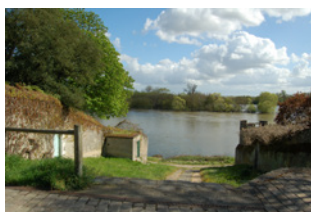
Venelle d'accès à la Loire Sainte-Gemmes-sur-Loire