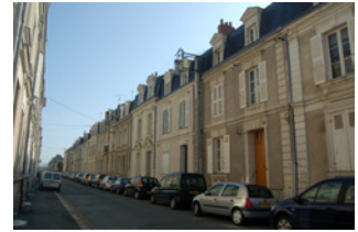
Rue du Quinconce Angers