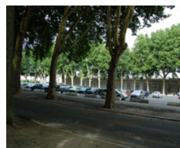
Place de la Rochefoucault Angers