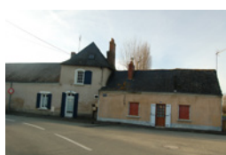
La Chansonnière Briollay

Sont identifiés dans cette sous-catégorie des bâtis correspondant à des exploitations agricoles, horticoles, viticoles, des anciennes fermes, etc. marquant le paysage rural de par leur qualité architecturale et/ou leur volumétrie importante.