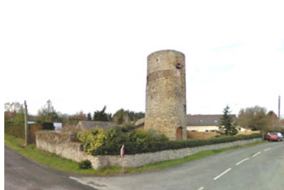
Moulin de la Fenêtre Saint-Martin- du-Fouilloux