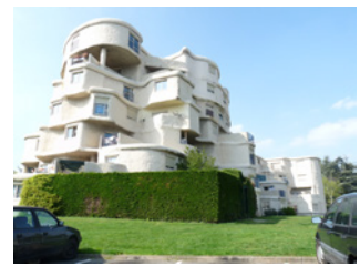
Les Kalougines Angers