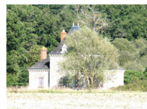
Pavillon de chasse Ecuillé