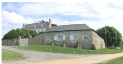
« Le Manoir » Briollay

Nota : Les ensembles remarquables qui font l'objet d'un classement « p » sur le zonage ne sont pas identifiés au titre de l'article L 151-19 (ancien article L 123-1-5-III-2°)