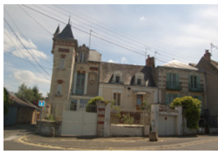
Port du Grand Large Les Ponts-de-Cé