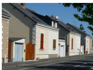
Cité ouvrière de la Lignerie Saint-Barthélemy-d'Anjou

Sont identifiés dans cette sous-catégorie des ensembles qui présentent des séquences de modules singuliers.