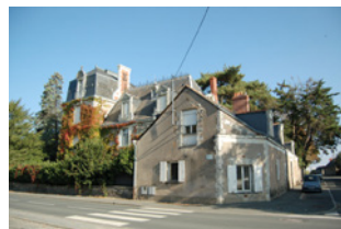
Maison de Maître « la Bénéturie » 110 rue du Maréchal Juin Angers