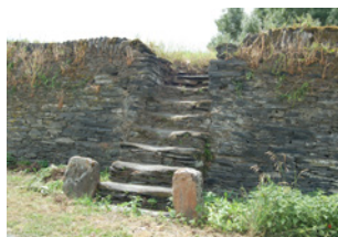
Loire-Authion La Daguenière escalier et mur - Les Baillis

Sont identifiés dans cette sous-catégorie les ouvrages hydrauliques du bord de Loire, héritage de l'économie fluviale du XIX ème siècle, indissociables du paysage ligérien.