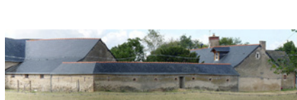
La Grillonnière Cantenay-Epinard