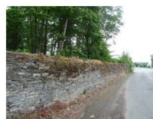
Mur Château de Pignerolle Saint-Barthélemy-d'Anjou