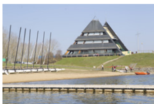
Centre nautique Angers

Sont identifiés dans cette sous-catégorie des bâtiments à usage culturel et d'intérêt de par leur architecture singulière telle que des équipements scolaires : écoles, collèges, etc.