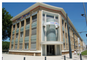
Ancienne Usine des Luisettes Angers