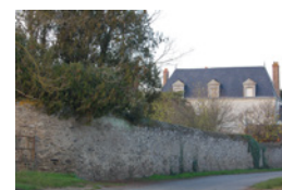
Les Brosses Mûrs-Erigné