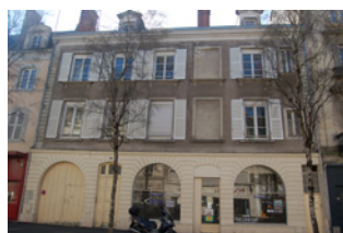
Maison Monsaillé 33 rue Boisnet Angers