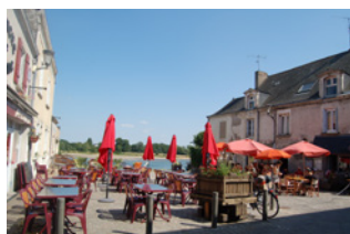
Port de la Pointe Bouchemaine