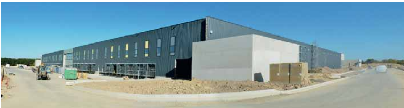
Leroy Merlin installera sa plateforme logistique Grand Ouest dans le hub de 42 000 m 2 , en cours de construction à l'ouest d'Angers.

A près Action en juin, Leroy Merlin annonce à son tour l'implantation, à Angers, de sa plateforme logistique Grand Ouest. Celle-ci sera opérationnelle début 2019 et permettra l'approvisionnement d'une trentaine de magasins. Choisie pour son positionnement géographique, Angers a abattu une autre carte maîtresse. Celle du hub logistique de grande envergure que l'investisseur Stam Europe fait actuellement construire par PRD, le spécialiste français de l'immobilier logistique. Situé