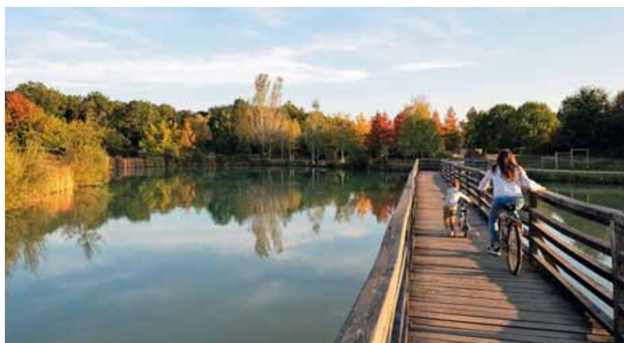
Le parc André-Delibes et son château à motte appelés à devenir des sites de plus en plus touristiques.

tous types avec des maisons et des appartements en location ou à l'acquisition pour favoriser la mixité sociale. “Contrairement à ce que l'on pourrait penser, le nombre d'habitants n'augmente pas pour autant, indique le maire. Cela nous permet simplement de renouveler la population, qui avait connu une forte croissance avec l'arrivée de familles au milieu des années 1990, dont les enfants sont désormais partis.” L'essentiel pour conserver un niveau de services et continuer à attirer de nouveaux habitants. Sans pour autant perdre son âme de village. ■