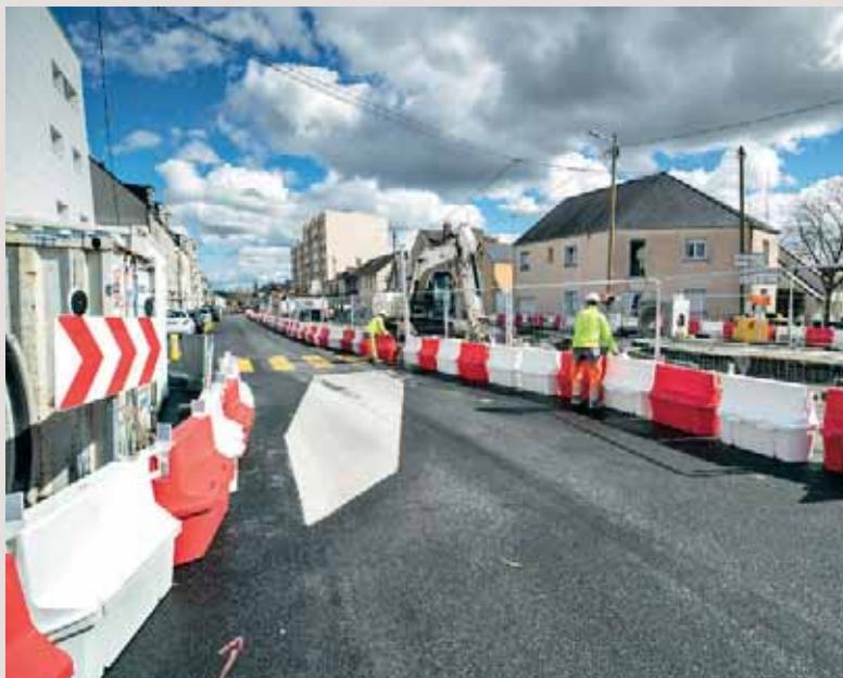
20 millions d'euros seront investis sur la ligne B du tramway en 2018.