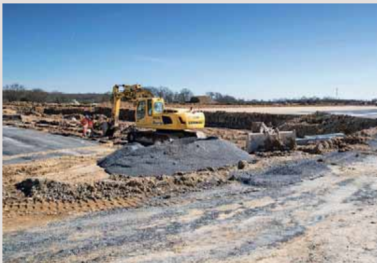
Les zones d'aménagement concertées, ici celle de Saint-Léger-des-Bois, sont un important poste d'investissement.