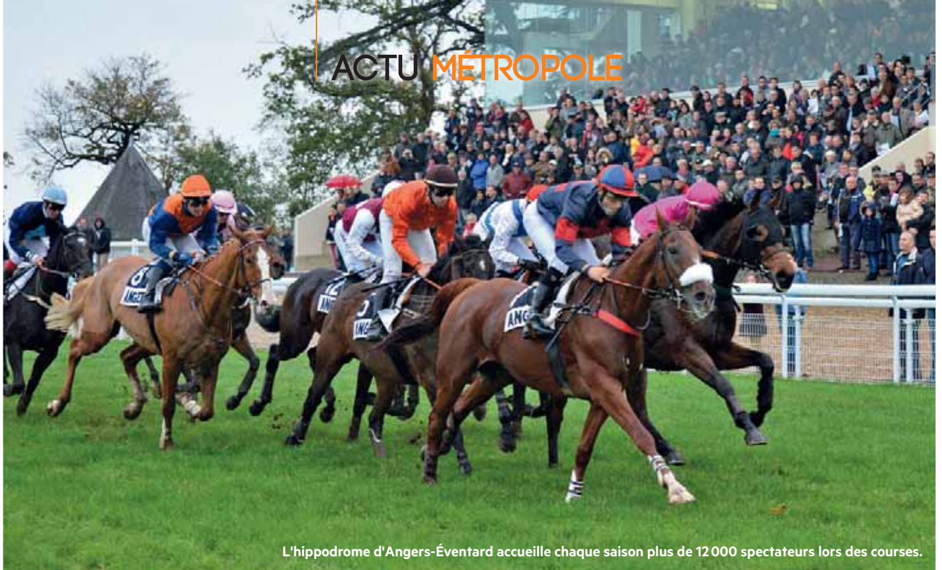
L'hippodrome d'Angers-Éventard accueille chaque saison plus de 12 000 spectateurs lors des courses.