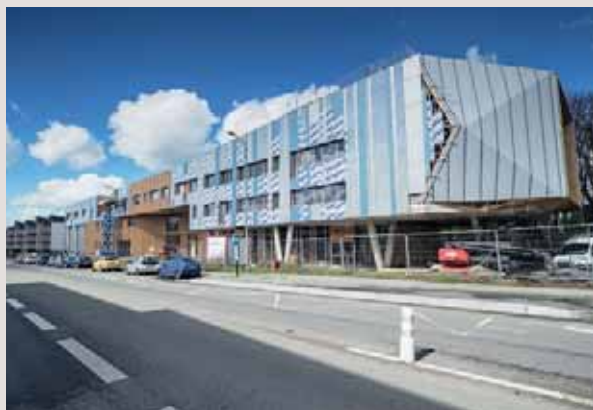
L'agglomération participe à la construction du bâtiment de la nouvelle école d'ingénieurs, ISTOM.