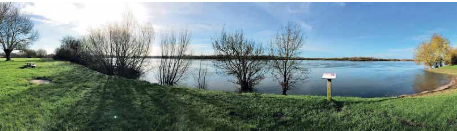
La Daguenière, ce sont des ports qui racontent l'histoire de la marine de Loire dans la commune.

la vallée de l'Authion réalisé sous l'égide d'Edgar Pisani a fini d'asseoir la vocation semencière et horticole des terres agricoles de la commune. Contraint par un plan de prévention des risques inondation (PPRI), Camille Chupin y voit plutôt un atout non négligeable: "Ça nous permet d'éviter l'étalement urbain. Nous sommes 1 300 et notre volonté est de se maintenir à 1 300 habitants, en privilégiant les lieux de rencontre, en bord de Loire, autour de la halte vélo, de la bibliothèque et de la maison médicale, et du côté du tout nouveau gymnase omnisports. C'est le meilleur moyen de garder l'identité et la personnalité de la commune." ■