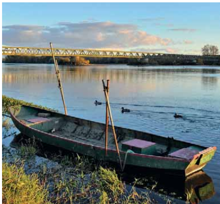
La Loire, ici à Saint-Mathurin-sur-Loire, regarde du côté du Danube cette année.

Renseignements : 02 4157 37 55 www.loire-odysee.fr