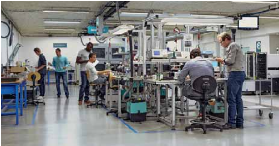
Les délégations pourront découvrir la Cité de l'objet connecté.

Durant la semaine du WEF, les délégations internationales se feront une idée précise du degré d'engagement des entreprises du territoire dans ce monde du tout-connecté. Pilotées par le cluster angevin We Network, des visites les conduiront sur des sites de production où la santé, la maison, la sécurité, l'agriculture, les transports et l'énergie connectés sont déjà une réalité. L'autre enjeu de ces découvertes : mieux comprendre et aborder ce que les entreprises traditionnelles doivent