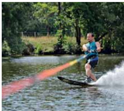
Ski nautique sur la Mayenne.