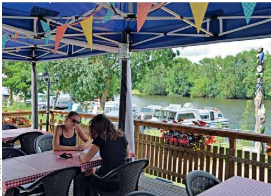
La guinguette, face au port.

Deux chemins de randonnée permettent de découvrir Pruillé. Le sentier des Crêtes et de la Mayenne, rive droite, propose une boucle de 9,25 kilomètres. Rive gauche, les 9,5 kilomètres du circuit des Ajoncs empruntent le bac "Le Trait d'Union" pour la traversée de la Mayenne et permet de découvrir trois chênes multi centenaires inscrits à l'inventaire des arbres remarquables.