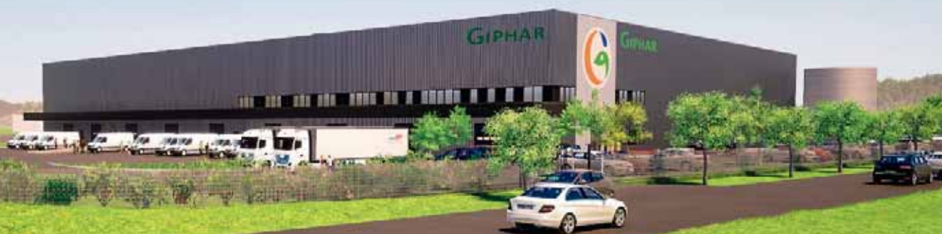
La plateforme logistique sera créée sur le parc d'activités de l'Atlantique, à Saint-Léger-des-Bois.