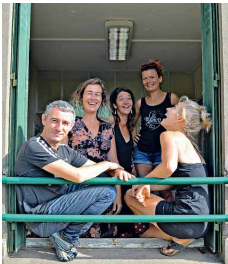
L'ancien bureau de Poste a été reconverti en lieu artistique.

*Les compagnies de la Postière: Cie Gaïa, Collectif Citron, Cie du Cri, Cie Nom d'un Bouc!, Cie Rosilux, Cie Omi Sissi, Vintage Caravane.