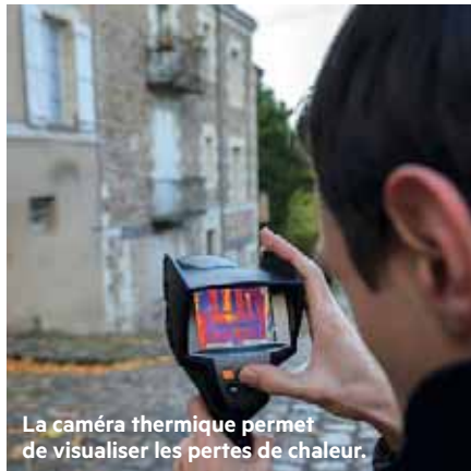
La caméra thermique permet de visualiser les pertes de chaleur.

L'Agence locale de l'énergie et du climat (Alec) propose l'opération "Traque aux watts" à dix communes du territoire et à leurs habitants: Villevêque, Les Ponts-de-Cé, Mûrs-Érigné, Avrillé, Saint-Martin-du-Fouilloux, Verrières-en-Anjou, Saint-Barthélemy-d'Anjou, Soucelles, Sarrigné et le Village-Anjou à la Roseraie. Objectifs: permettre aux propriétaires de visualiser les pertes de chaleur et ponts thermiques de leur logement, les sensibiliser à l'importance d'une isolation renforcée et les informer sur les moyens d'y parvenir. À l'aide d'une caméra thermique, un conseiller énergie photographie les maisons des personnes volontaires, invitées à une réunion d'information sur les enjeux de l'isolation et les dispositifs d'accompagnement. Un conseil personnalisé leur est ensuite proposé, avec la possibilité de réaliser un "passport énergie" de leur habitation. "Au-delà