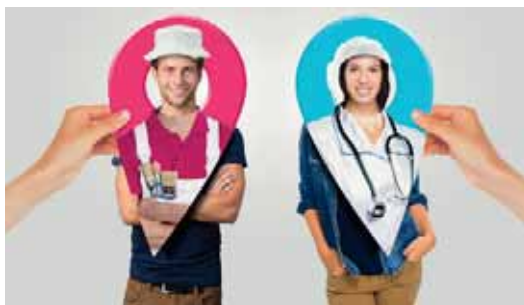
Aldev facilite la relation entre entreprises et chercheurs d'emploi.

133 ENTREPRISES ACCOMPAGNÉES PAR ALDEV au cours du 1 er semestre 2016 pour leurs besoins de recrutement.