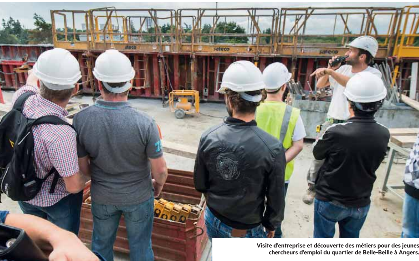
Visite d'entreprise et découverte des métiers pour des jeunes chercheurs d'emploi du quartier de Belle-Beille à Angers.