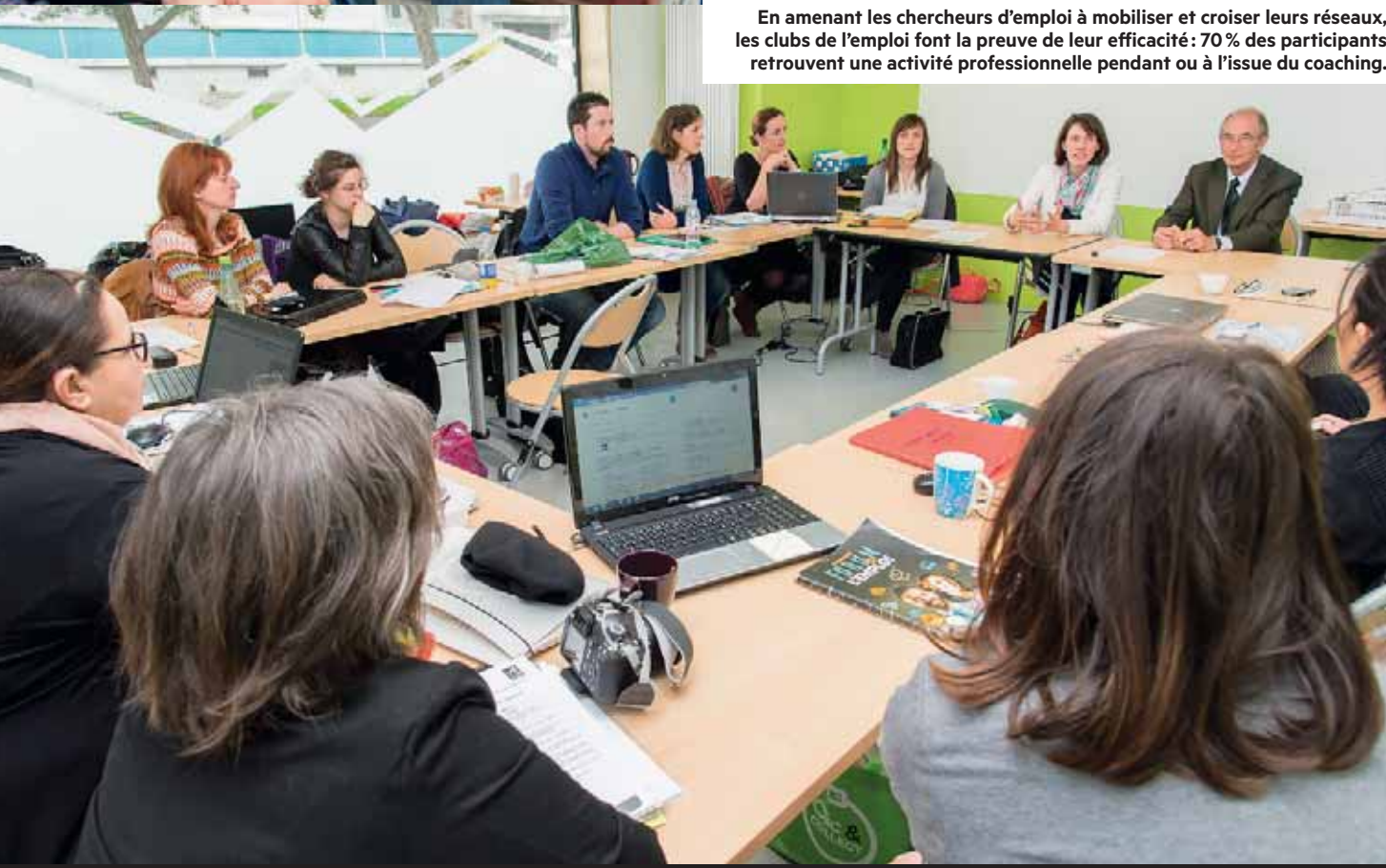
En amenant les chercheurs d'emploi à mobiliser et croiser leurs réseaux, les clubs de l'emploi font la preuve de leur efficacité: 70 % des participants retrouvent une activité professionnelle pendant ou à l'issue du coaching.