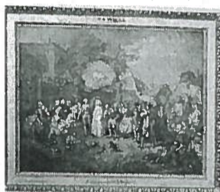
Le tableau de Wille présenté ce samedi à Alençon. Sur une estimation de 60 à 80 000 €.